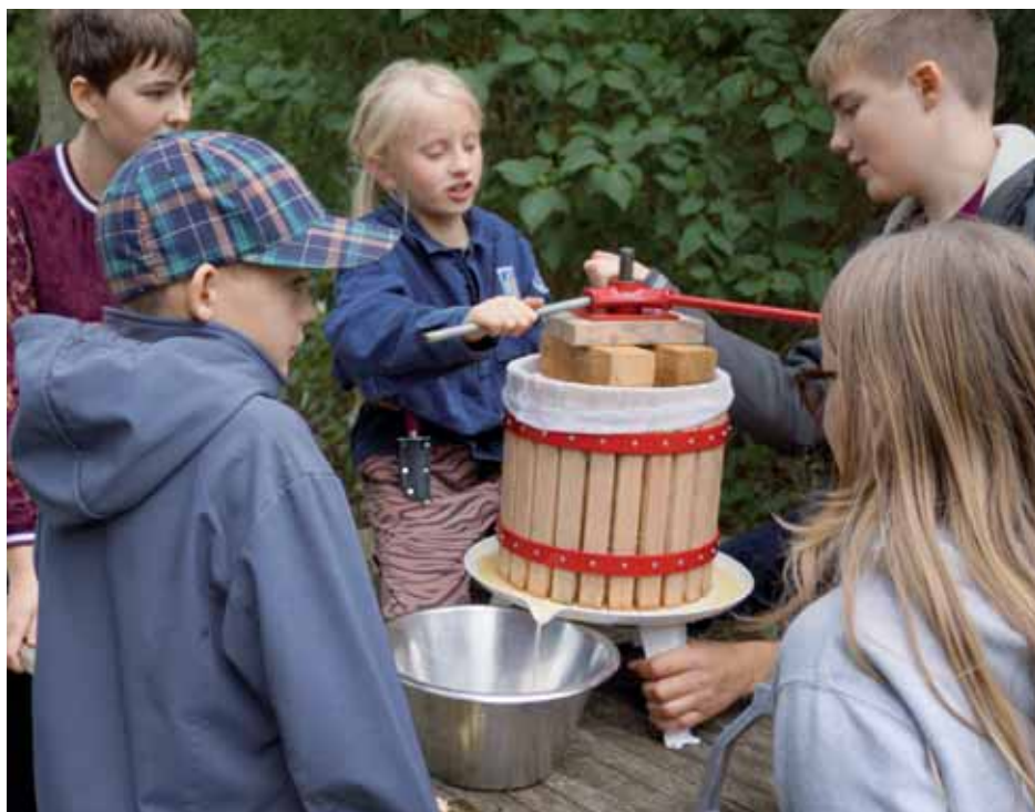
Æblemostpresen stilles op i haven for forbindelse med høstgudstjenesten den 22. september.

Skriv venligst navn og hvor mange I kommer. /Hårslev Sogns Lokalråd