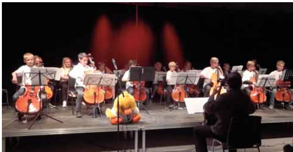
Celloekspresen spiller ved sensommerkoncerten den 8. september.