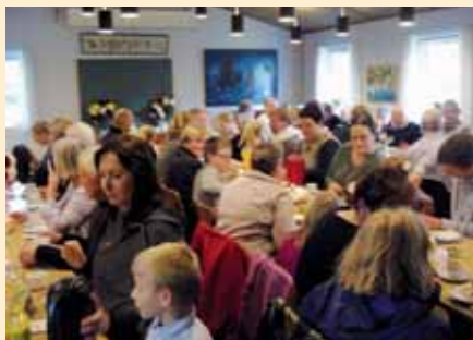
Lagkagespisning i konfirmandstuen ved tidligere høstgudstjeneste.

Efter gudstjenesten samles vi i konfirmandstuen til det traditionelle kaffebord med hjemmelavede lagkager i rigelige mængder. Vi plejer at være 70-90 personer til kaffen og skal bruge minimum 12 lagkager. Hvis du har lyst til at bidrage til arrangementet med