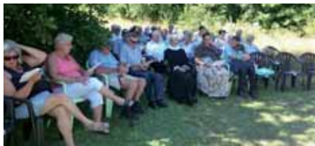
Friluftsgudstjeneste i sommervej.

Da tiden var kommet til at sige tak for i dag, var der en, der sagde, at hvis gudstjenesterne altid foregik på den måde, ville der komme flere til søndagens gudstjenester. Men så er der jo igen det med vejret, det danske vejr er i hvert tilfælde ikke til friluftsgudstjenester hele året!