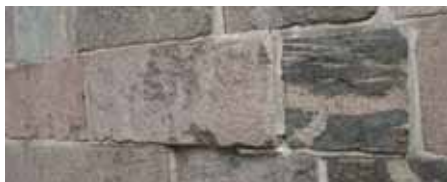
Uforklarlig sætning i murværket.

Den udvendige kalkning af kirken har vi skubbet til 2016. Hvis vind og vejr tillader det, så bliver kirken kalket inden konfirmationen den 1. maj.