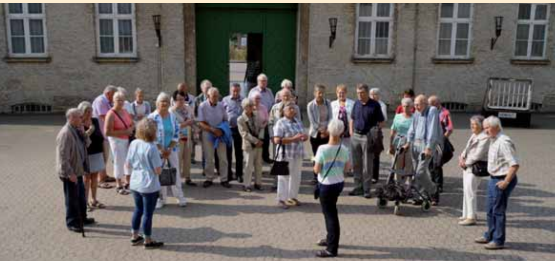
Sommerudflugtsdeltagere i Horsens Statsfængsel.